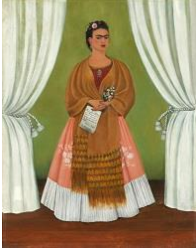
Autorretrato Dedicado a Leon Trotsky, 1937

La artista mexicana Frida Kahlo es recordada por sus autorretratos, dolor y pasión, y colores atrevidos y vibrantes. Es celebrada en México por su atención a la cultura mexicana e indígena y por las feministas por su descripción de la experiencia y la forma femenina.