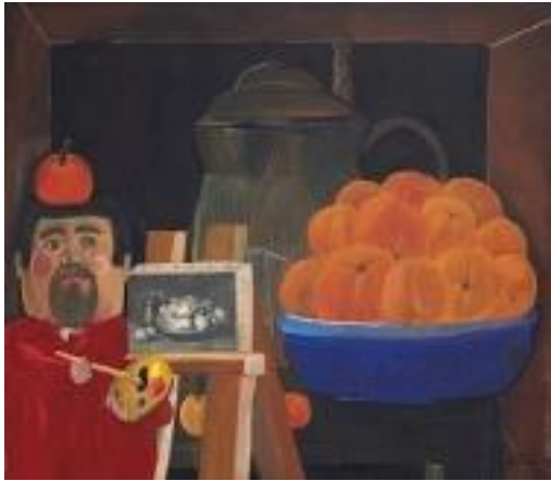
Autorretrato con Naturaleza Muerta (según Courbet), 1963

Nacido en Colombia en 1932, Fernando Botero abandonó la escuela de toreros para convertirse en artista, mostrando su obra por primera vez en 1948. Su arte posterior, ahora expuesto en las principales ciudades del mundo, se concentra en el retrato situacional unido por la exageración proporcional de sus sujetos. Este estilo se llama boterismo.