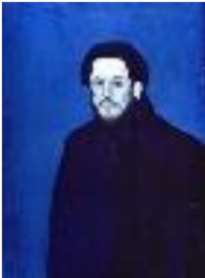
Autorretrato, 1901